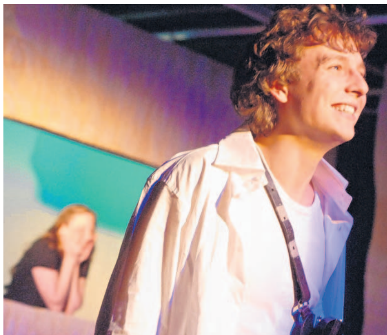
Ein bezaubernder Romeo und eine hinreißende Julia.

Im heute beginnenden zweiten Bauabschnitt werden nach der Fällung des Bestandes 64 Kastanienbäume neu gepflanzt. Die gesamte Erneuerung der „Allées en terrasse“ soll in Abschnitten über mehrere Jahre erfolgen und 2012 abgeschlossen sein, heißt es. zg